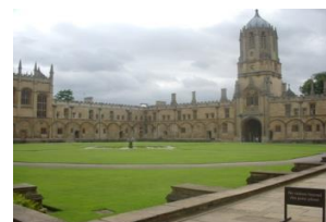
クライストチャーチ