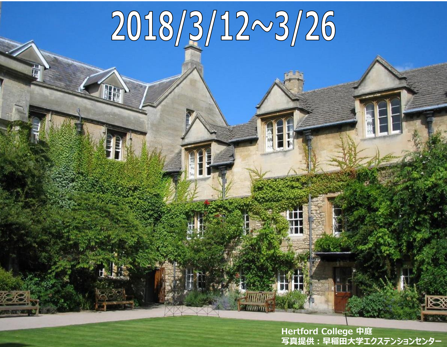
Hertford College 中庭