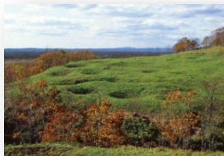
北斗遺跡展示館 地表面から観察できる竪穴住居跡のくぼみ