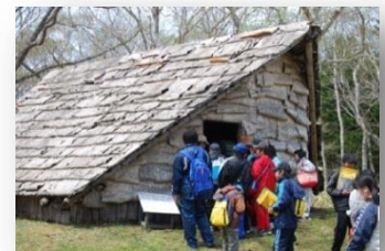
標津遺跡群 復元竪穴住居