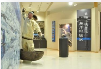
モロ貝塚館 内観